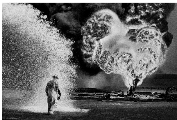
Los aerosoles químicos protegen a este bombero contra el calor de las llamas. Gran Burhan, después de la Guerra del Golfo. Kuwait. 1991.