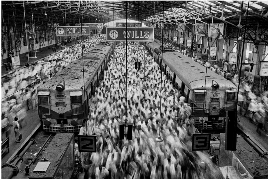
Church Gate Station. Bombay (Mumbai), India. 1995.