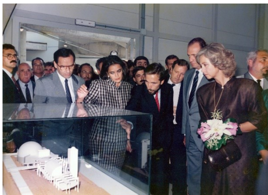
1986. Con SSMM los Reyes don Juan Carlos y Doña Sofía y el vicepresidente del Gobierno, Alfonso Guerra, en la inauguración del Planetario.