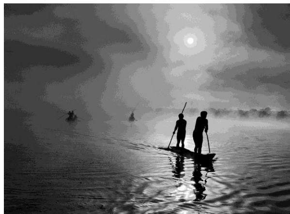
Grupo de Waura pescando en el lago de Piyulaga. Haut-Xingu, Mato Grosso, Brasil. 2005.

Desde 1990, Lélia y Sebastião están empeñados en la restauración del bosque Atlántico del estado de Minas Gerais. Con éxito: en 1998 lograron crear una reserva de la naturaleza y crearon el Instituto Terra, dedicado a la reforestación, conservación y educación medioambiental.