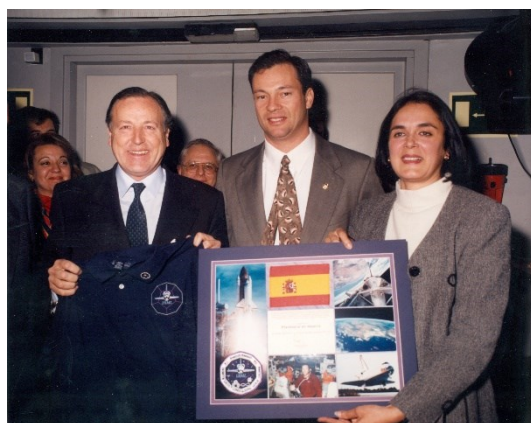
1995. Con el alcalde de Madrid, J. M a Álvarez del Manzano, y el astronauta de origen español Miguel López Alegria.

También ha participado en 43 exposiciones, todas de carácter científico, siendo Comisaria, autora de los contenidos y el diseño de 17 de ellas. Entre todas, destacaremos: Hominidos: el origen del hombre , sobre la evolución humana; Paisajes de Marte , realizada empleando los mejores datos y fotografías de la misiones al planeta rojo; Sputnik, 50 años , para conmemorar el lanzamiento del primer satélite al espacio, y Viaje a Saturno , un recorrido por este planeta y su sistema de anillos y lunas de la mano de la misión Cassini de NASA.