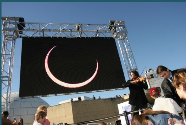
2005. Actuación de Ara Malikian durante los actos programados con motivo del eclipse anular.

Si hubiese que citar un hito en su trayectoria y en la del Planetario de Madrid, este podría ser la observación del eclipse anular de Sol de 2005. Más de 16.000 personas delante del edificio del Planetario disfrutaron de este espectacular fenómeno astronómico.